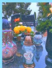
Stanisław Czerniewski SP2FMM 2019