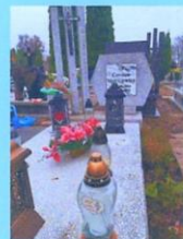
Czesław Mackiewicz SP2FWU 2015