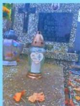
Leon Rychel SP2DOO 1995