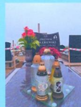
Zbigniew Gołębiwski SP2QCS 2021