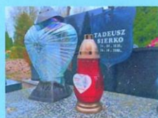
Tadeusz Sierko SP2JEG 2006